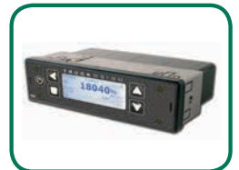
Montage DIN de type autoradio