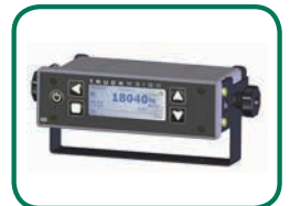
Montage tableau de bord