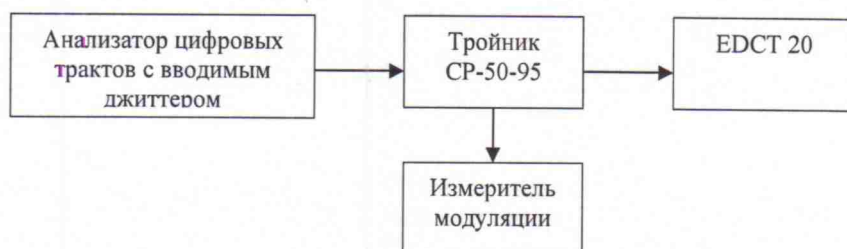
Рис.1. Схема для определения погрешности измерения размаха фазового дрожания.

7.5. Определение погрешности измерения размаха фазового дрожания производят на интерфейс PRI по схеме рис. 1.